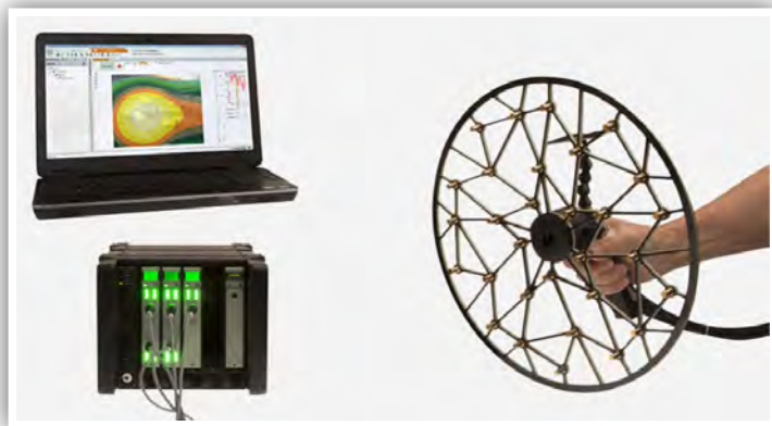
Sistema completo de cámara acústica, compuesto por un array portátil, un front end LAN-XI y un PC.

de ruidos molestos en la fase de I+D suponga una inversión mínima.