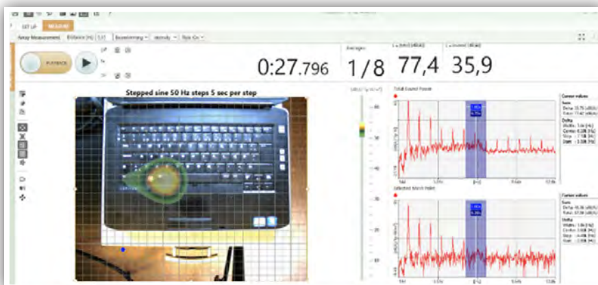
Acoustic Camera utilizado en medidas de precisión del tamborileo de teclados.

Esta función extra se puede escoger entre las siguientes: