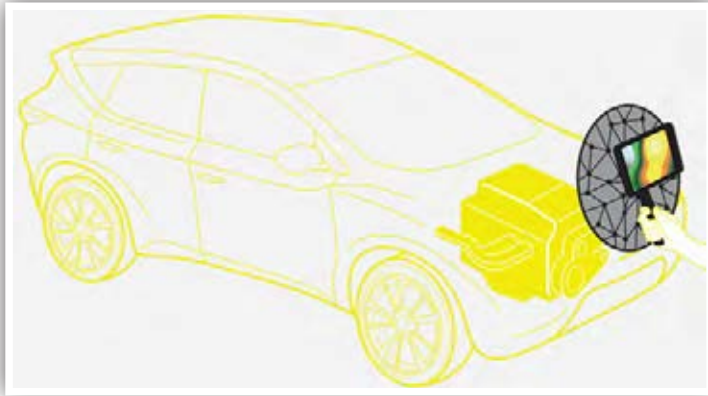
El Kit Acoustic Camera en uso, con la placa de reflexión y una tablet.

frecuencias, mientras que la holografía se puede usar a bajas frecuencias, ya que su resolución viene dada por la distancia entre los micrófonos.