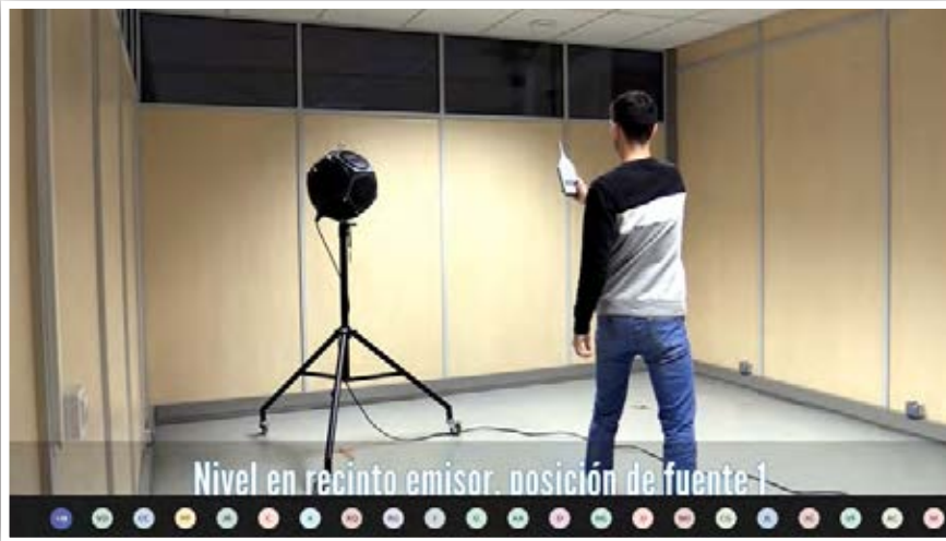
CESVA live WEBINARS: Medición de aislamiento acústico con el método de barrido manual y el software CIS02.