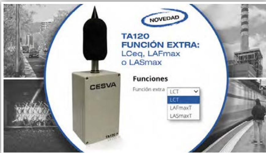
Sensor de ruido TA120.

LCEq: Nivel sonoro continuo equivalente con ponderación frecuencial C. Función utilizada junto con el LAeq para evaluar la presencia de componentes de baja frecuencia según RD 1367/2007. La presencia de componentes de baja frecuencia es muy habitual en ruido procedente de infraestructuras de transporte, obras y especialmente de actividades de ocio con música amplificada.