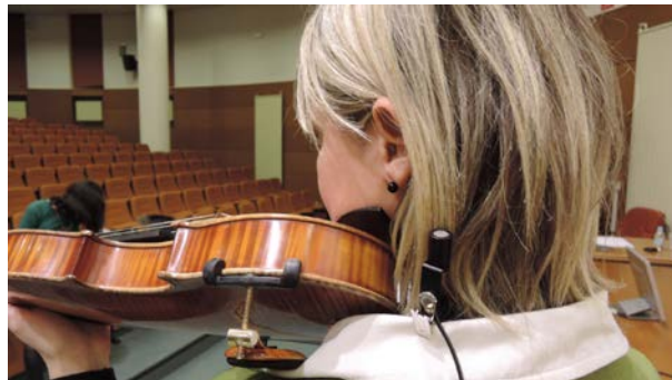
Figura 3 – Posición del micrófono

El micrófono del dosímetro se situó, sujeto al cuello de la camisa de las violinistas a una distancia aproximada de 100 mm del oído.