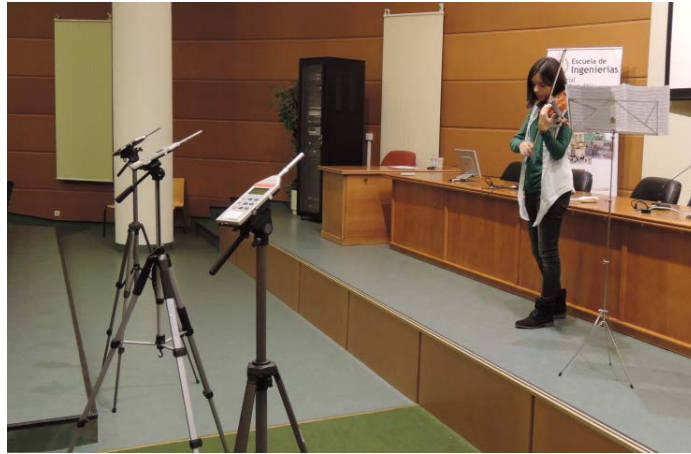
Figura 2 – Medición en el salón de actos de la Escuela de Ingeniería Industrial de León

El primer ensayo se desarrolló en tres bloques, en el salón de actos de la Escuela de Ingeniería Industrial de León: El primer bloque: las violinistas interpretaron la misma obra de forma individual (una vez), por lo tanto se realizaron tres mediciones. La obra seleccionada fue: “Escala en sol mayor con arpeggios”. Obra utilizada para calentar y para mejorar la habilidad de los practicantes. La primera interpretación la realizó la primera violinista no muy rápido, la segunda interpretación la realizó la segunda violinista rápido y la tercera interpretación la realizó la segunda violinista muy rápido. El segundo bloque: las violinistas interpretaron la misma obra de forma individual y conjunta (una vez), por lo tanto se realizaron tres mediciones. La obra seleccionada fue: “Allemanda de la Partita nº2 Bach para violín”. El tercer bloque: las violinistas interpretaron de forma individual y conjunta (una vez), por lo tanto se realizaron tres mediciones. La obra seleccionada fue: “Capricho nº 5 de Rode”.